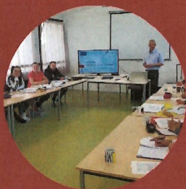
SALLES DE COURS

NOUS METTONS TOUT EN OEUVRE POUR QUE NOS ETUDIANTS S'ÉPANOUISSENT ET PRENNENT PLAISIR À SE FORMER