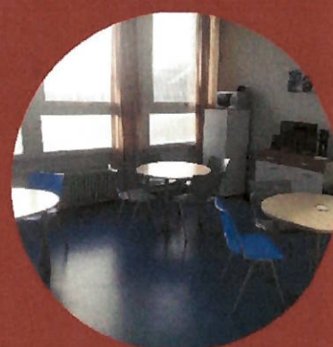
PAUSES ET REPAS